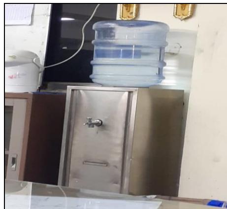
รูปที่ 2-4 น้ำดื่ม บริเวณโรงงาน