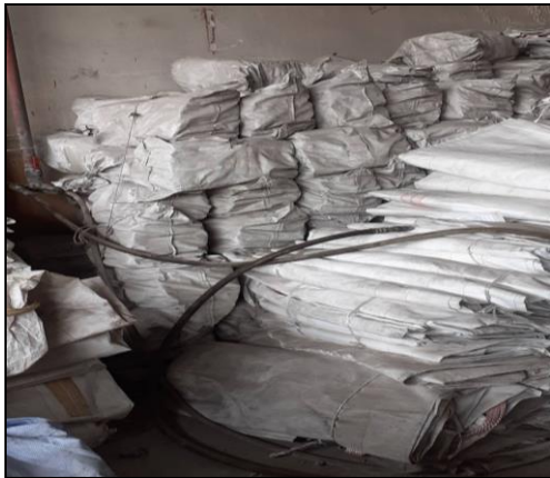
รูปที่ 2-1 ถุงกรอง