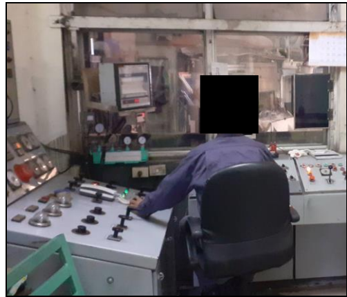
รูปที่ 2-2 ห้องควบคุม (Control Room)